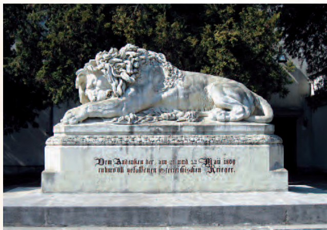
Der Asperner Löwe - Denkmal zum Gedenken an die Schlacht gegen Napoleon 1809.