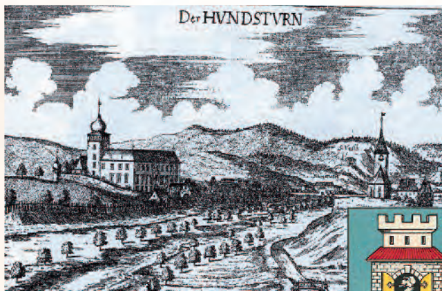
Das Schloss Hundsturm im 17. Jhdt.