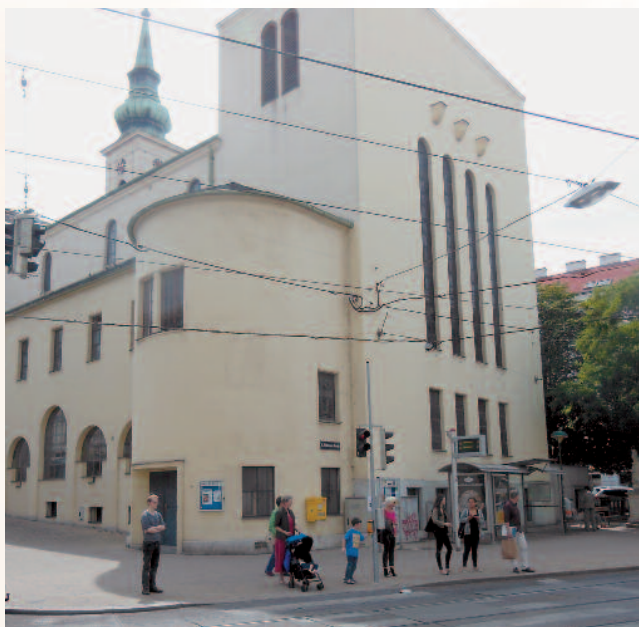
Mitten im Grätzl, das spätbarocke Baujuwel, die Pfarrkirche St. Gertrud.