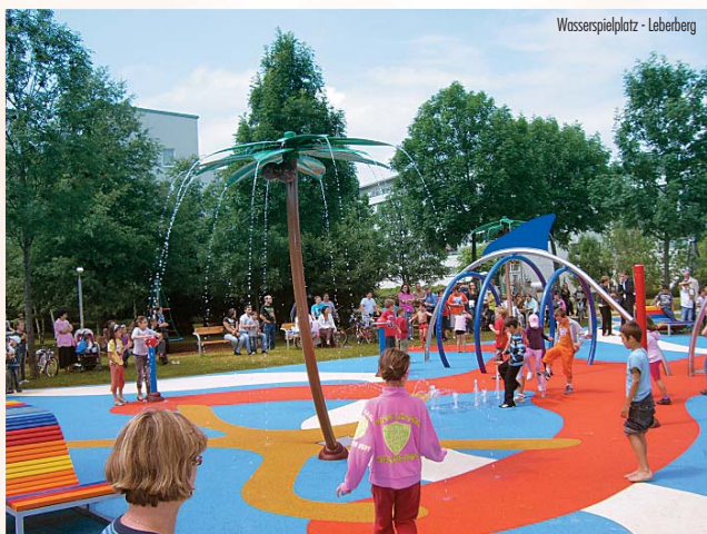
Wasserspielplatz - Leberberg